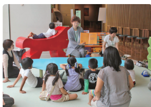
※過去の読み聞かせの様子

福岡アジア美術館では、2012年よりボランティアによる読み聞かせを行っています。アジアの国や地域のお話を、絵本や紙芝居で、お子さまと一緒に楽しみください。その日参加される方々の年齢や人数にあわせて絵本を選びます。大人の方だけのご参加も大歓迎です。 今後も、福岡よかトピア国際交流財団と共催で、不定期にアジア各地の言語と日本語での読み聞かせを企画する予定です。