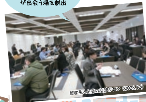
留学生と企業の交流サロン (2023.12)