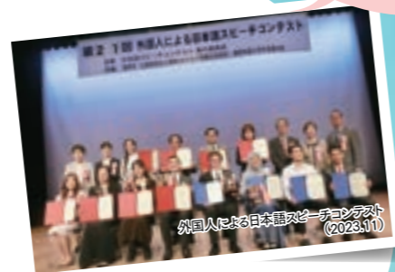
外国人による日本語スピーチコンテスト (2023.11)