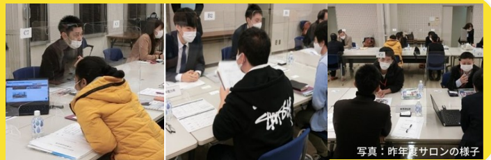
写真：昨年度サロンの様子

후쿠오카에 취업하길 희망하는 유학생과 해외 고도 인재 확보에 관심 있는 지역 기업이 상호 문화를 이해하고, 유학생이 후쿠오카에 정착하는데 필요한 기반 조성을 목적으로 하는 ‘유학생과 지역 기업 교류회’를 실시합니다. 편안한 분위기에서 취업활동에 관한 조언을 얻거나 질문, 명함 교환 등이 가능합니다. 취업 고민이 있으시거나 일본 취업에 불안함이 있는 유학생분들!