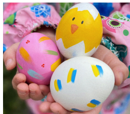
アメリカの イースターエッグ