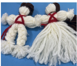
ウクライナの 人形