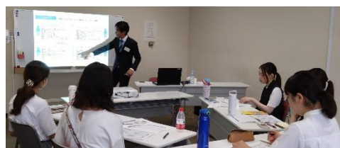
(令和5年度留学前研修)