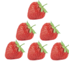
여섯 여섯 개