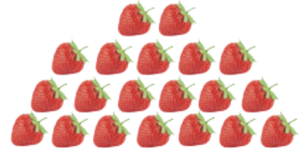
스물 스무 개