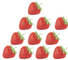
열하나 열한 개