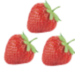
셋 세 개