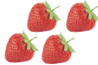
넷 네 개