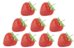
아홉 아홉 개