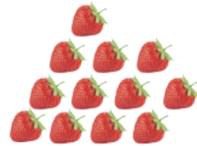
열둘 열두 개