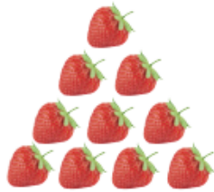
열 열 개