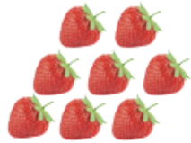
여덟 여덟 개