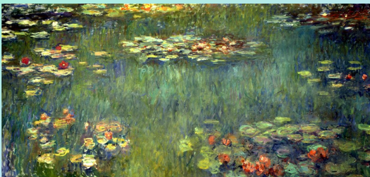
클로드 모네 <수련 연못, 녹색 반사> 1920 - 26년, 유채, 캔버스