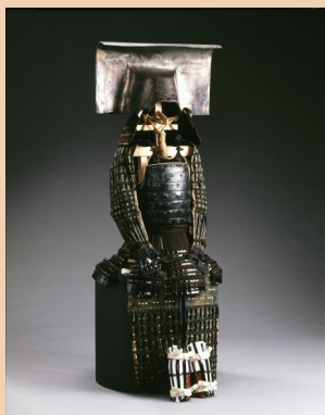
(重要文化财产) 银箔押一之谷型兜・黑系威胴丸具足

通过实战不断进化的刀剑和甲冑。系统介绍其历史性变迁。包括从平安时代出现的大铠、腹卷到桃山时代当世具足的样式变迁和与其联动的刀剑变迁。